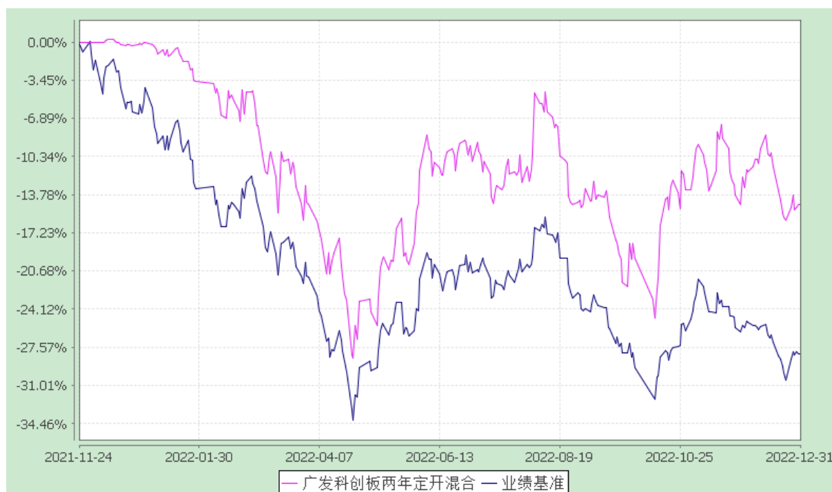
广发科创板两年定期开放混合型证券投资基金 份额累计净值增长率与业绩比较基准收益率的历史走势对比图 (2021 年 11 月 24 日至 2022 年 12 月 31 日)

注：本基金建仓期为基金合同生效后 6 个月，建仓期结束时各项资产配置比例符合本基金合同有关规定。