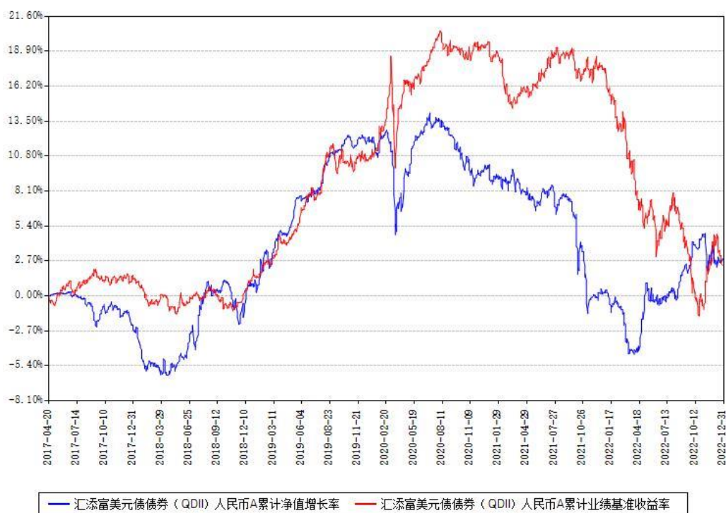
汇添富美元债券（QDII）人民币A累计净值增长率与同期业绩基准收益率对比图