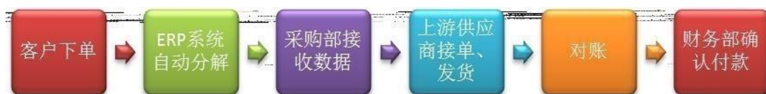
原材料采购下单流程

公司建立严格的原材料供应商备选制度，对原材料供应商的服务、规模、交货能力以及价格进行综合考评。公司原材料采购下单由微软ERP系统自动生成。销售部门接到客户订单后，ERP系统根据内部生产表设定原材料采购数量，并自动将数据分解后送至采购部，由采购部联系上游供应商下单。目前采购部门人员配备完善，工作职责定位清晰。在供应链管理方面，建立在双方信任和紧密合作的前提下，公司要求某些特定材料的供应商建设HUB仓制度（即原材料预先存放在公司的仓库，领用材料时才视同提货）。公司通过订单系统将建立HUB仓制度的原材料的日存货数据每日整理提交供应商，原材料供应商则根据HUB仓剩余的材料数量下达发货指令。HUB仓制度在采购流程上与普通采购流程无大差别，但在生产中更加有利于公司原材料提用和生产顺利进行。目前，采用HUB仓模式的主要是主材FCCL、屏蔽膜、化学品和部分通用元器件的供应商。