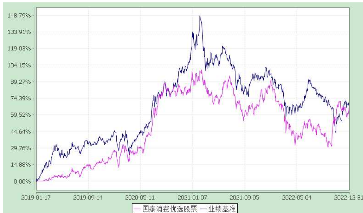
自基金合同生效以来份额累计净值增长率与业绩比较基准收益率的历史走势对比图 (2019 年 1 月 17 日至 2022 年 12 月 31 日)

注：本基金合同生效日为 2019 年 1 月 17 日，本基金的建仓期为 6 个月，在建仓期结束时，各项资产配置比例符合合同约定。