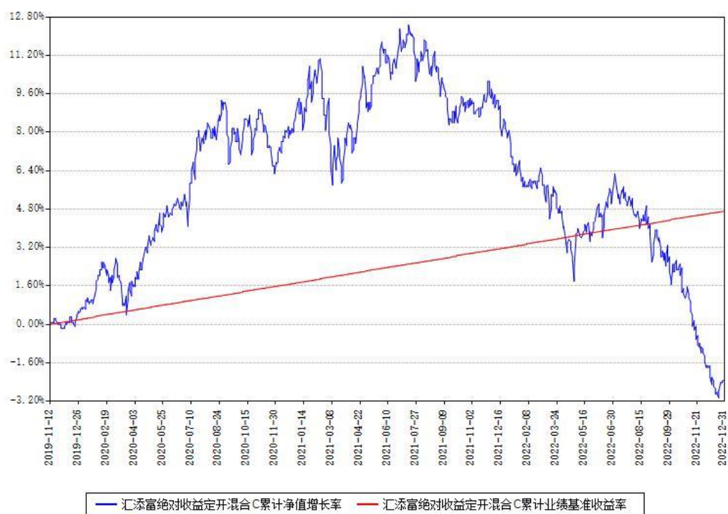
汇添富绝对收益定开混合C累计净值增长率与同期业绩基准收益率对比图