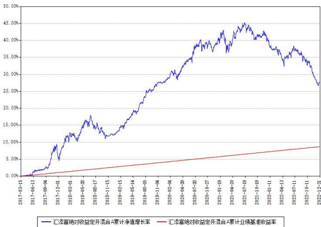
汇添富绝对收益定开混合A累计净值增长率与同期业绩基准收益率对比图