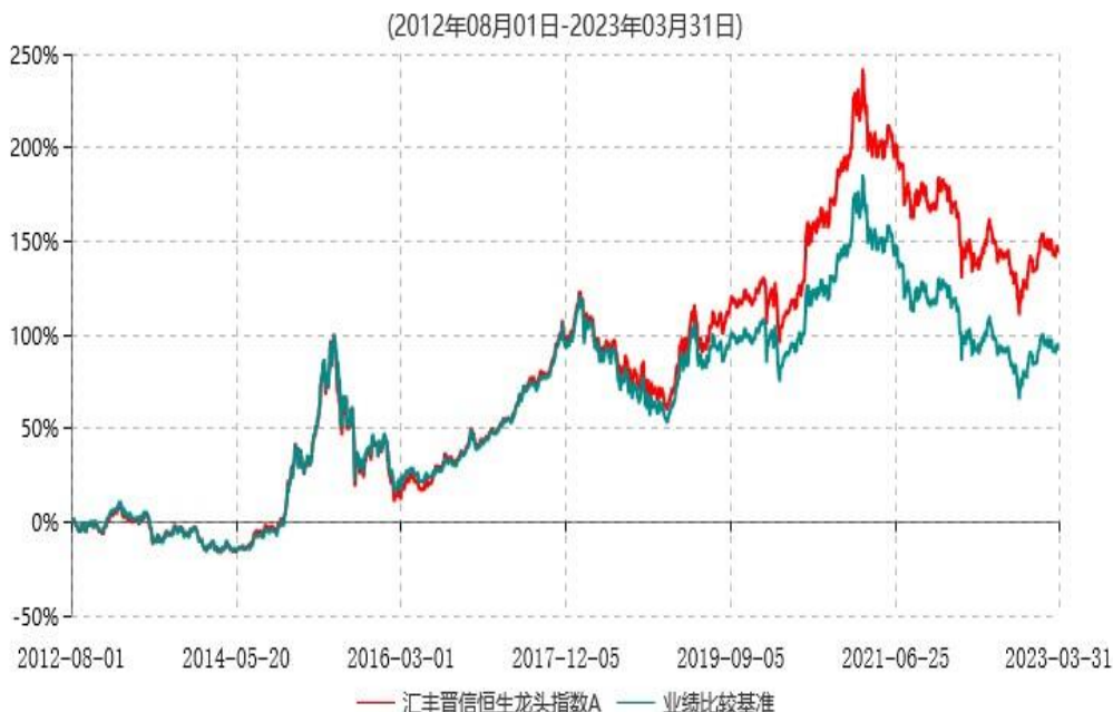
汇丰晋信恒生龙头指数A累计净值增长率与业绩比较基准收益率历史走势对比图