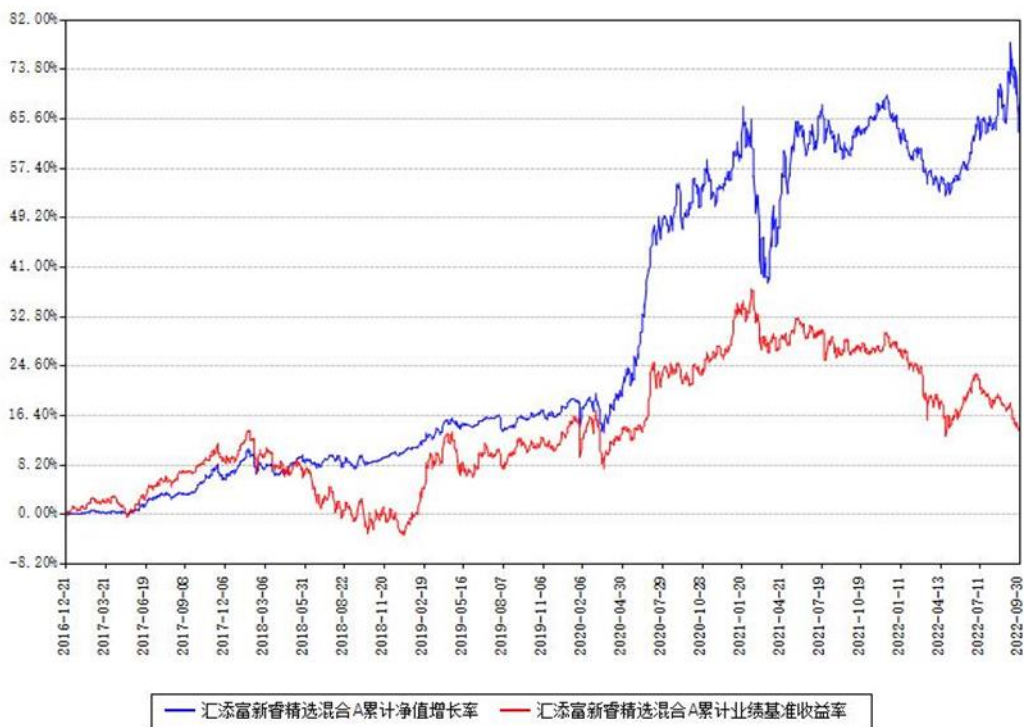
汇添富新睿精选混合A累计净值增长率与同期业绩基准收益率对比图

(二)自基金合同生效以来基金累计净值增长率变动及其与同期业绩比较基准收益率变动的比较图