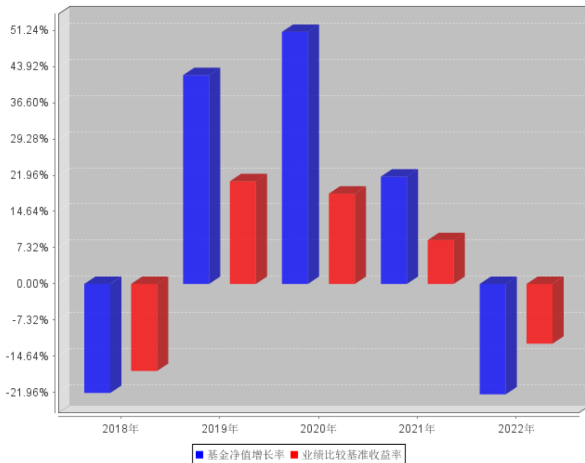
过去五年基金每年净值增长率及其与同期业绩比较基准收益率的对比图