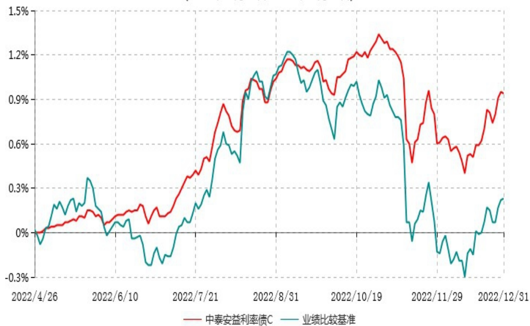
中泰安益利率债C累计净值增长率与业绩比较基准收益率历史走势对比图 (2022年04月26日-2022年12月31日)

期末，本基金已建仓完毕，且建仓期结束时，本基金各项资产配置比例符合基金合同约定。