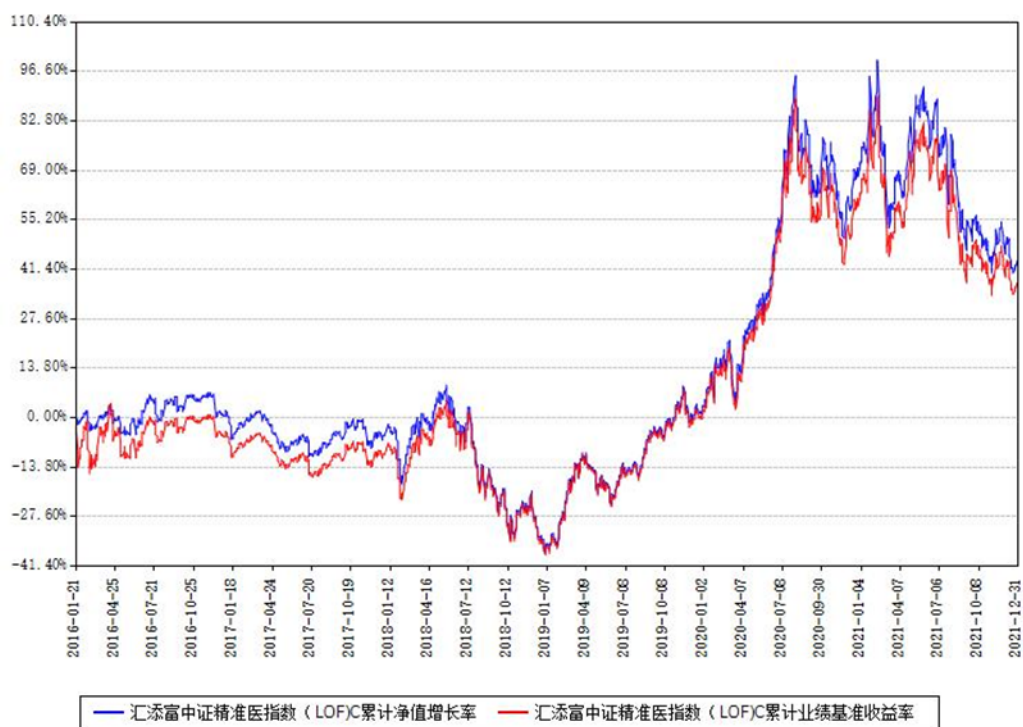
汇添富中证精准医指数（LOF）C累计净值增长率与同期业绩基准收益率对比图