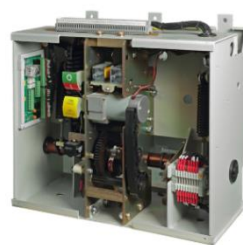
中高压断路器操作机构