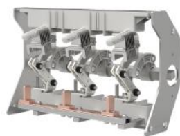
环网柜负荷开关单元开关