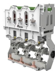
环网柜断路器单元开关