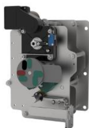
环网柜负荷开关单元操作机构