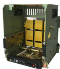
低压断路器框（抽）架