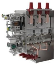
环网柜断路器单元气箱