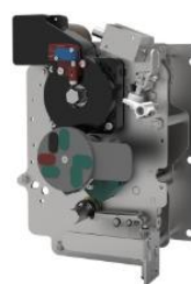
环网柜组合电器单元操作机构