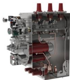
环网柜组合电器单元气箱