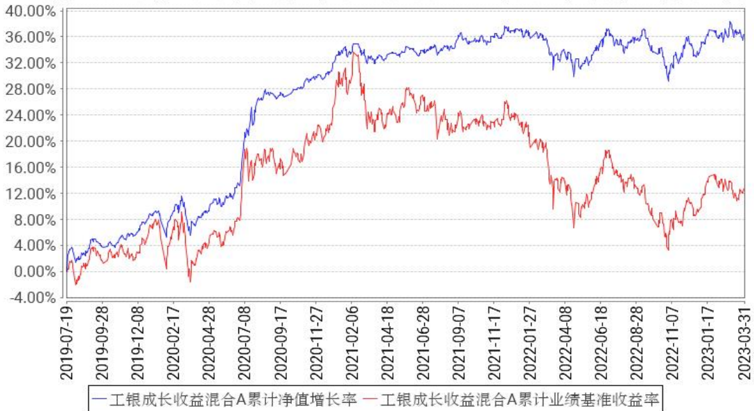
工银成长收益混合A累计净值增长率与同期业绩比较基准收益率的历史走势对比图