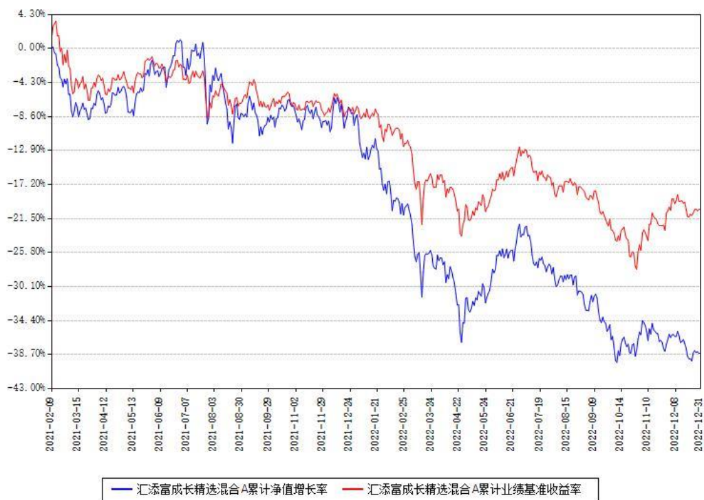
汇添富成长精选混合A累计净值增长率与同期业绩基准收益率对比图

(二) 自基金合同生效以来基金累计净值增长率变动及其与同期业绩比较基准收益率变动的比较