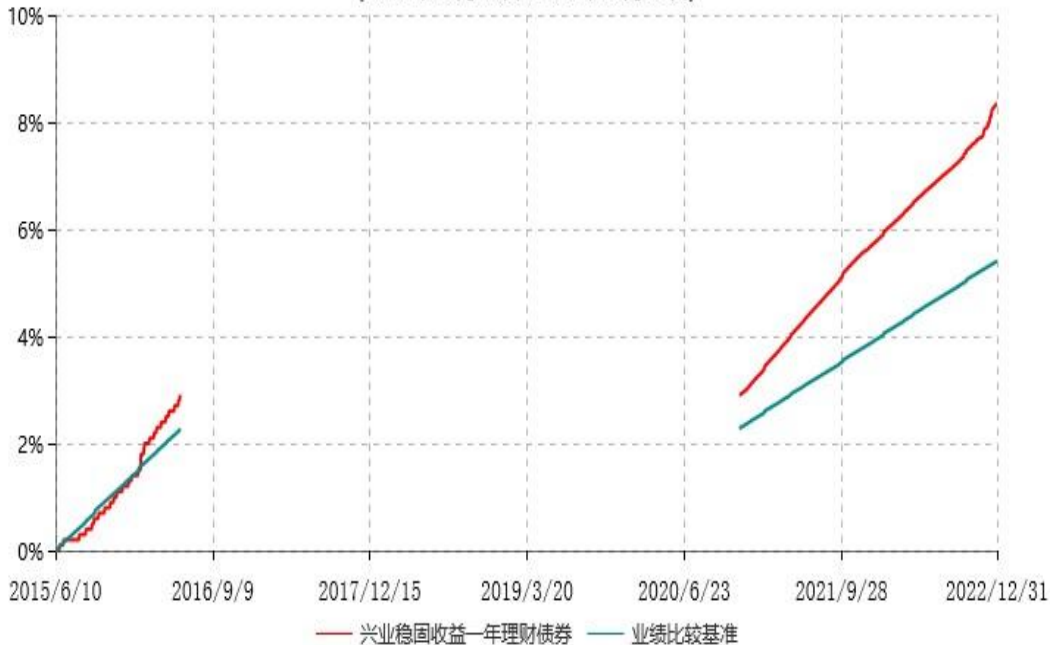
兴业稳固收益一年理财债券型证券投资基金累计净值增长率与业绩比较基准收益率历史走势对比图 (2015年06月10日-2022年12月31日)

注：净值表现按实际存续期计算。本基金成立于2015年6月10日，2016年6月13日本基金第一个运作期届满后暂停下一运作期运作，2020年12月1日起重启本基金的运作。