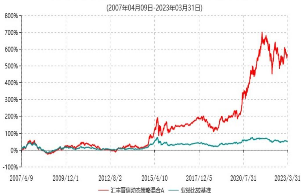
汇丰晋信动态策略混合A累计净值增长率与业绩比较基准收益率历史走势对比图

注：1. 按照基金合同的约定，本基金的投资组合比例为：股票占基金资产的 30%-