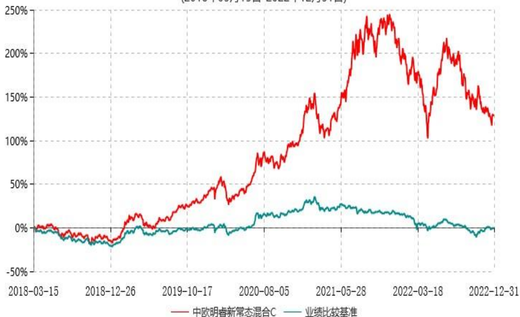
中欧明睿新常态混合C累计净值增长率与业绩比较基准收益率历史走势对比图 (2018年03月15日-2022年12月31日)

注：2021年9月8日起组合业绩比较基准变更为沪深300指数收益率*60%+中证港股通综合指数(人民币)收益率*20%+中债综合指数收益率*20%。本基金于2018年3月14日增加C类份额，图示日期为2018年3月15日至2022年12月31日。