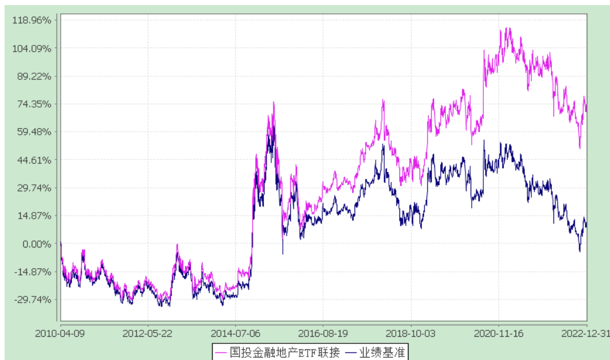
份额累计净值增长率与业绩比较基准收益率的历史走势对比图 (2010 年 4 月 9 日至 2022 年 12 月 31 日)

注：本基金建仓期为自基金合同生效日起的 3 个月。截至建仓期结束，本基金各项资产配置比例符合基金合同及招募说明书有关投资比例的约定。