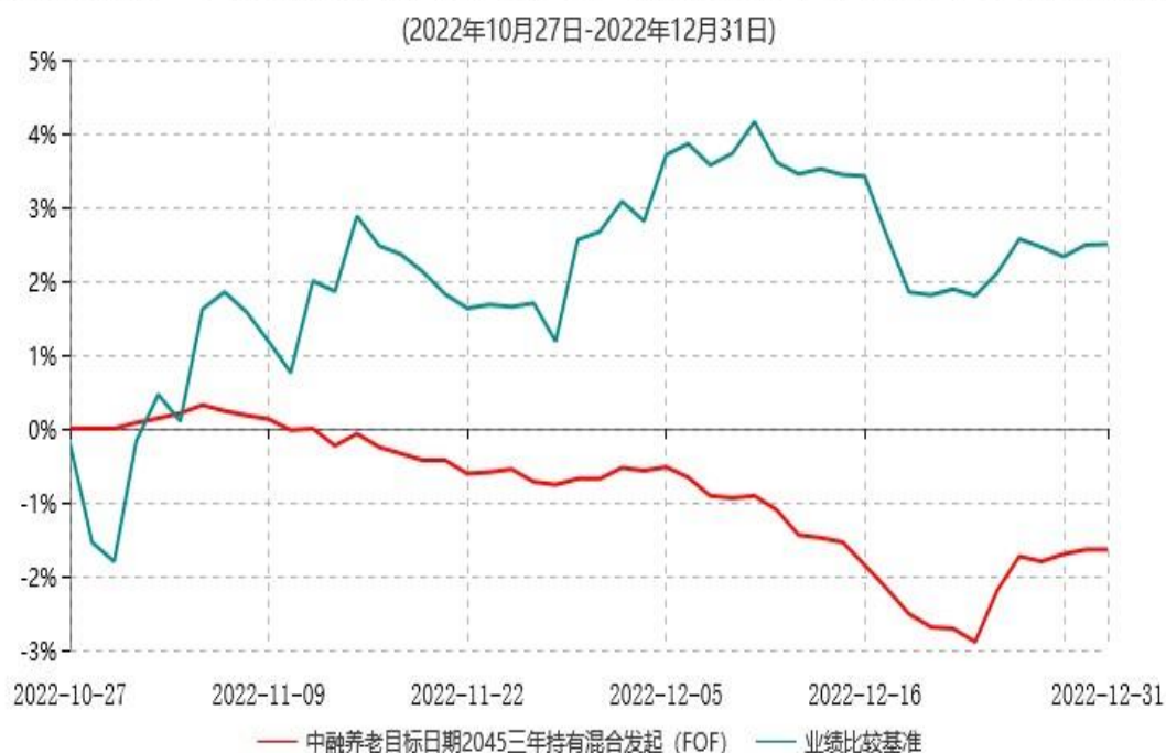
中融养老目标日期2045三年持有期混合型发起式基金中基金（FOF）累计净值增长率与业绩比较基准收益率历史走势对比图

注：按照基金合同和招募说明书的约定，本基金自合同生效日起6个月内为建仓期，截至本报告期末仍在建仓期内。基金合同生效日起至本报告期末不满一年。