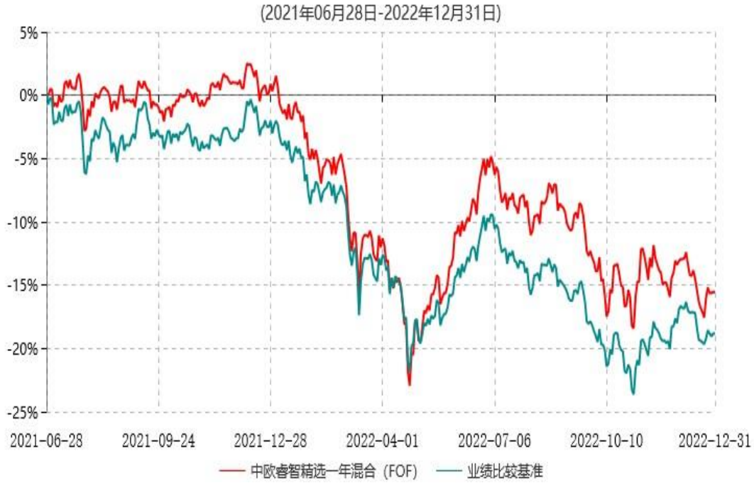
中欧睿智精选一年持有期混合型基金中基金（FOF）累计净值增长率与业绩比较基准收益率历史走势对比图