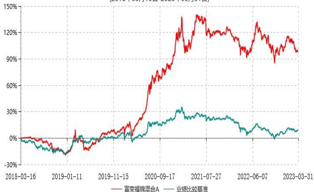
富荣福锦混合C累计净值增长率与业绩比较基准收益率历史走势对比图