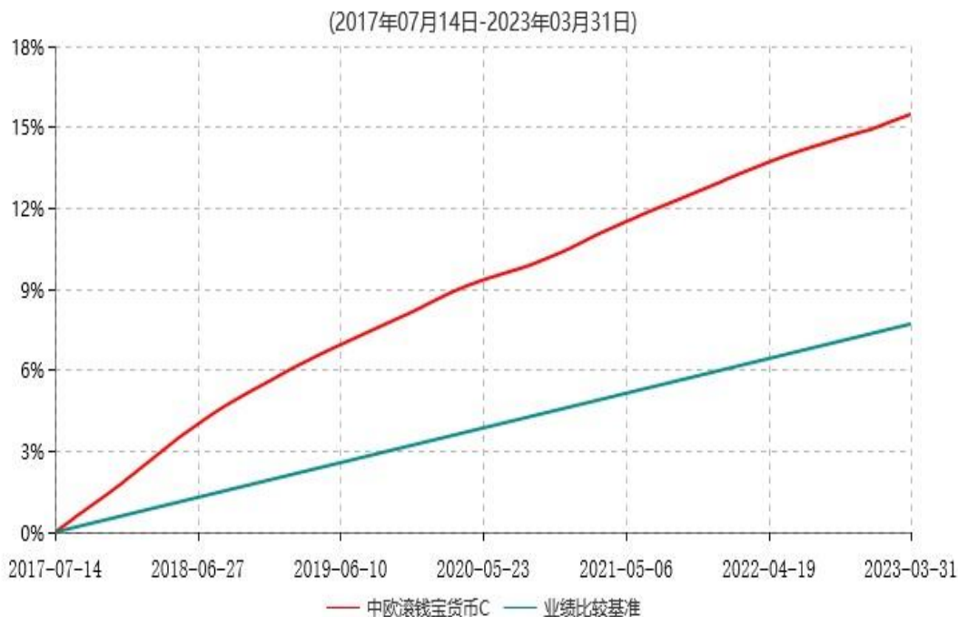
中欧滚钱宝货币C累计净值收益率与业绩比较基准收益率历史走势对比图

注：自 2017 年 7 月 12 日起，本基金增加 C 份额。图示日期为 2017 年 7 月 14 日至 2023 年 03 月 31 日。