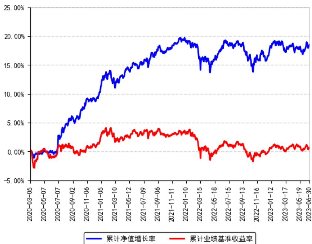
南方宝丰混合A累计净值增长率与同期业绩比较基准收益率的历史走势对比图