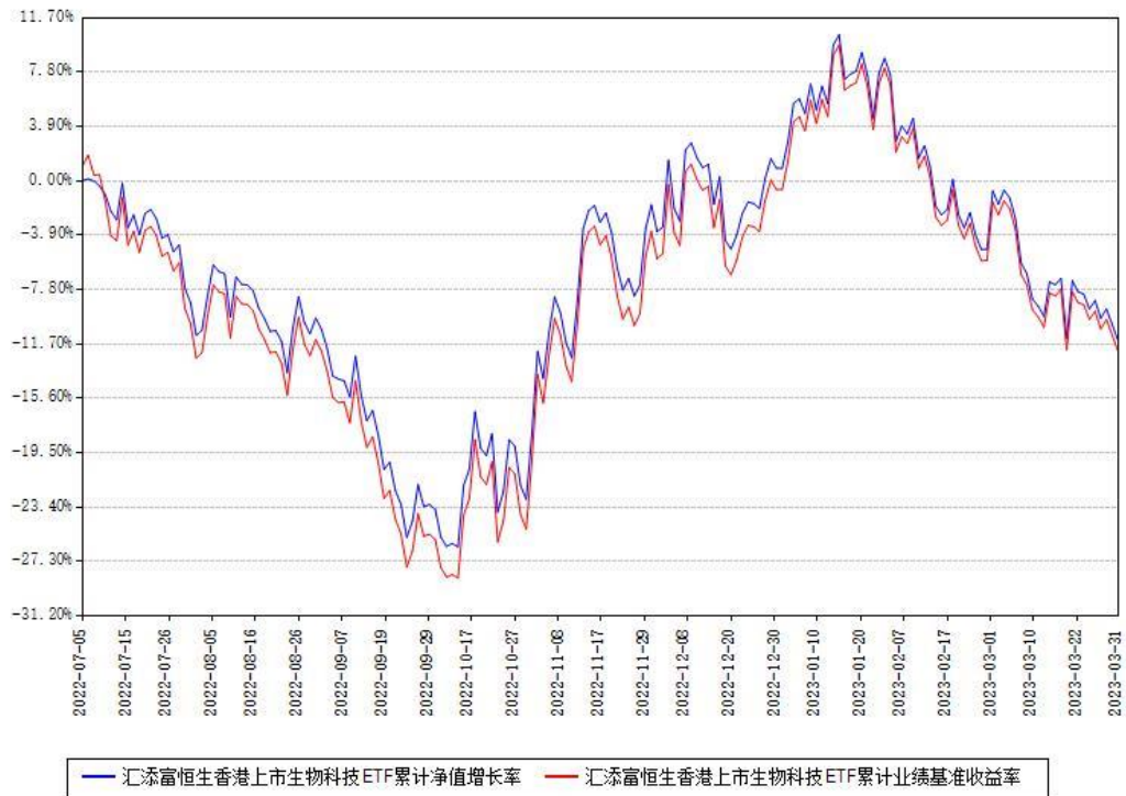
汇添富恒生香港上市生物科技ETF累计净值增长率与同期业绩基准收益率对比图