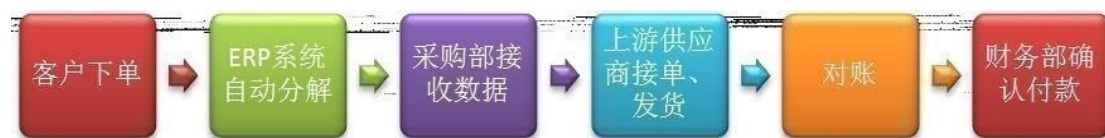
原材料采购下单流程

公司建立严格的原材料供应商备选制度，对原材料供应商的服务、规模、交货能力以及价格进行综合考评。公司原材料采购下单由微软ERP系统自动生成。销售部门接到客户订单后，ERP系统根据内部生产表设定原材料采购数量，并自动将数据分解后送至采购部，由采购部联系上游供应商下单。目前采购部门人员配备完善，工作职责定位清晰。在供应链管理方面，建立在双方信任和紧密合作的前提下，公司要求某些特定材料的供应商建设HUB仓制度（即原材料预先存放在公司的仓库，领用材料时才视同提货）。公司通过订单系统将建立HUB仓制度的原材料的日存货数据每日整理提交供应商，原材料供应商则根据HUB仓剩余的材料数量下达发货指令。HUB仓制度在采购流程上与普通采购流程无大差别，但在生产中更加有利于公司原材料提用和生产顺利进行。目前，采用HUB仓模式的主要是主材FCCL、屏蔽膜、化学品和部分通用元器件的供应商。