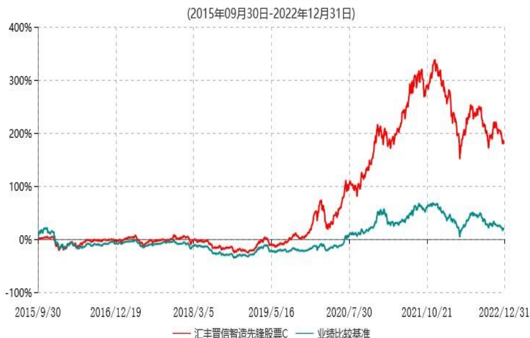
汇丰晋信智造先锋股票C累计净值增长率与业绩比较基准收益率历史走势对比图

3.上述基金净值增长率的计算已包含本基金所投资股票在报告期产生的股票红利收益。同期业绩比较基准收益率的计算未包含中证装备产业指数成份股在报告期产生的股票红利收益。