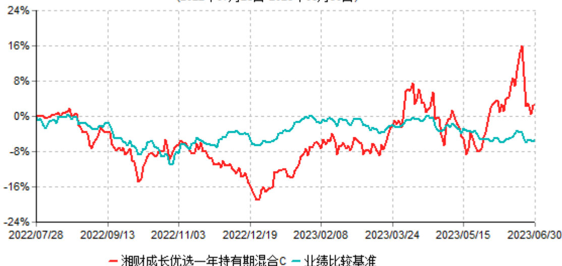
湘财成长优选一年持有期混合C累计净值增长率与业绩比较基准收益率历史走势对比图 (2022年07月28日-2023年06月30日)