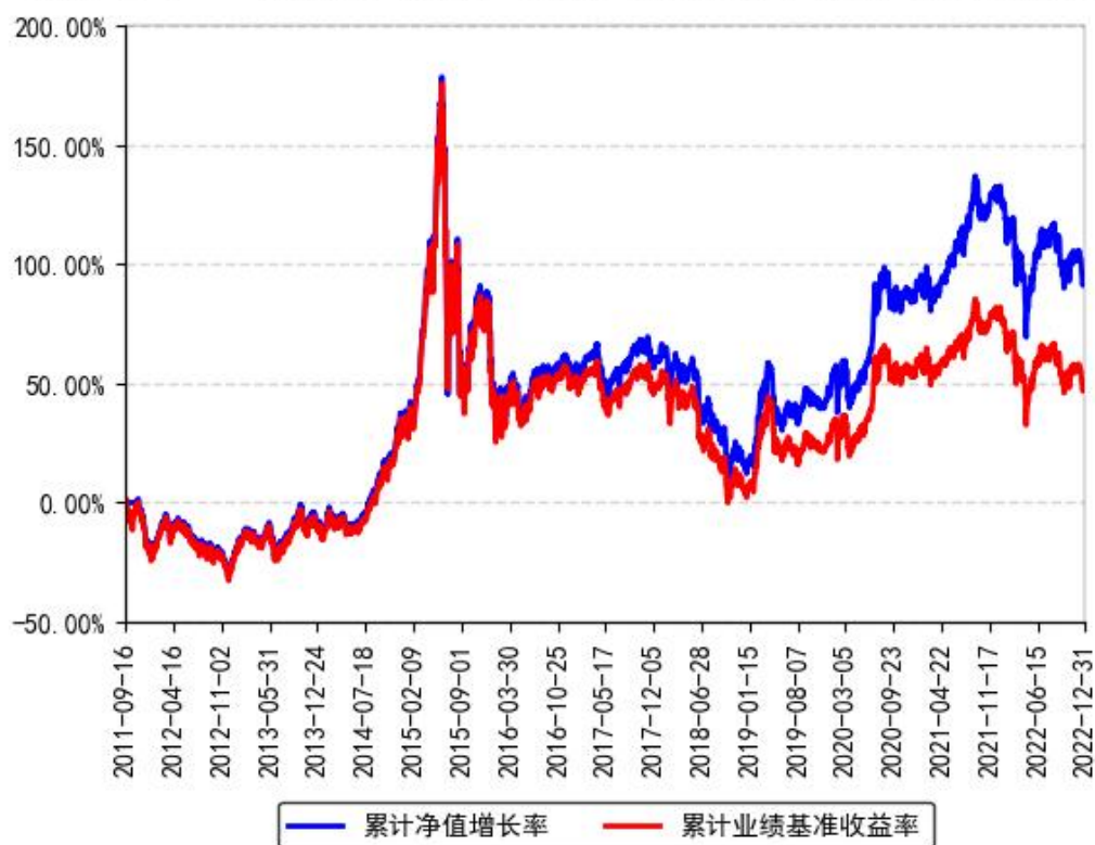
南方上证380ETF累计净值增长率与同期业绩比较基准收益率的历史走势对比图