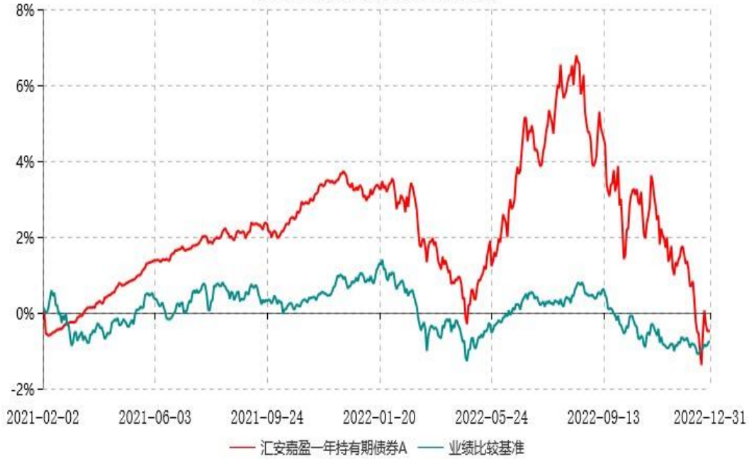
汇安嘉盈一年持有期债券C累计净值增长率与业绩比较基准收益率历史走势对比图