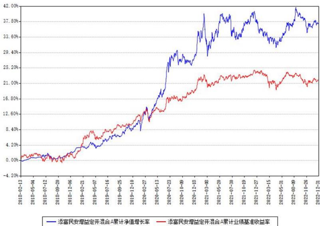
添富民安增益定开混合A累计净值增长率与同期业绩基准收益率对比图

(二)自基金合同生效以来基金累计净值增长率变动及其与同期业绩比较基准收益率变动的比较图