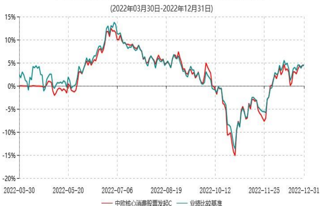
中欧核心消费股票发起C累计净值增长率与业绩比较基准收益率历史走势对比图

注：本基金基金合同生效日期为2022年3月30日，自基金合同生效日起到本报告期末不满一年，按基金合同的规定，本基金自基金合同生效起六个月为建仓期，建仓期结束时各项资产配置比例已符合基金合同约定。