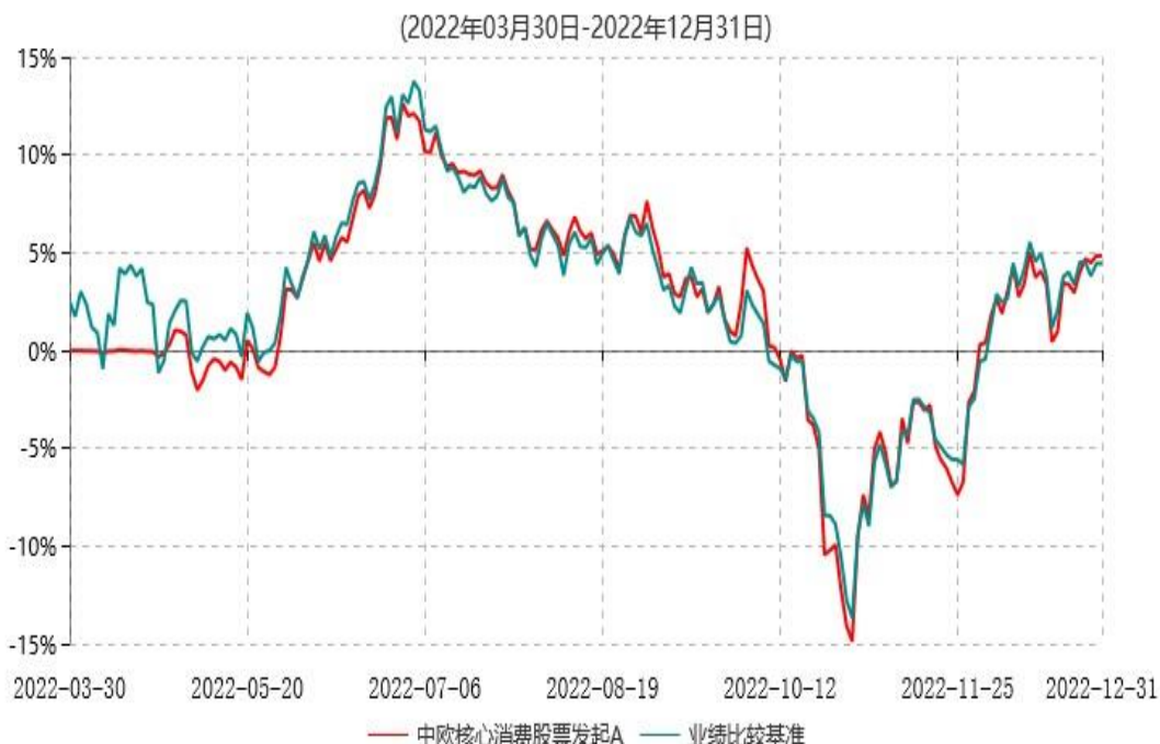
中欧核心消费股票发起A累计净值增长率与业绩比较基准收益率历史走势对比图

注：本基金基金合同生效日期为2022年3月30日，自基金合同生效日起到本报告期末不满一年，按基金合同的规定，本基金自基金合同生效起六个月为建仓期，建仓期结束时各项资产配置比例已符合基金合同约定。