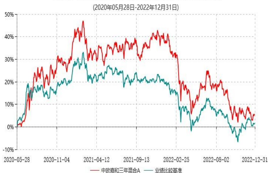
中欧嘉和三年混合A累计净值增长率与业绩比较基准收益率历史走势对比图