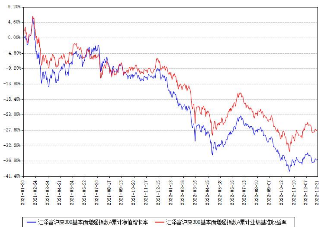
汇添富沪深300基本面增强指数A累计净值增长率与同期业绩基准收益率对比图