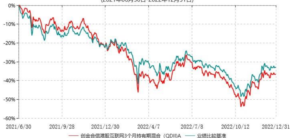
创金合信港股互联网3个月持有期混合（QDII）A累计净值增长率与业绩比较基准收益率历史走势对比图 (2021年06月30日-2022年12月31日)