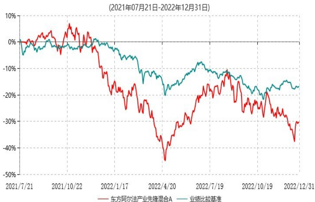
东方阿尔法产业先锋混合A累计净值增长率与业绩比较基准收益率历史走势对比图