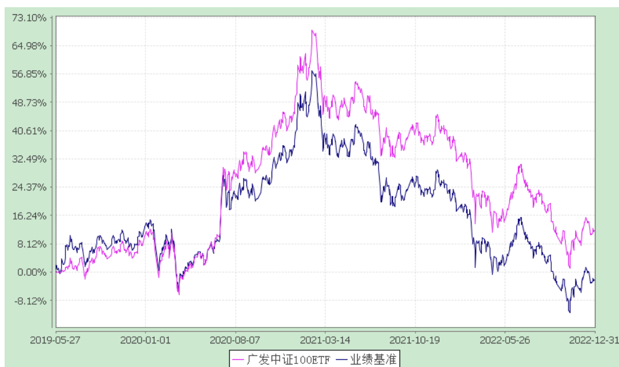
广发中证 100 交易型开放式指数证券投资基金 份额累计净值增长率与业绩比较基准收益率的历史走势对比图 (2019 年 5 月 27 日至 2022 年 12 月 31 日)