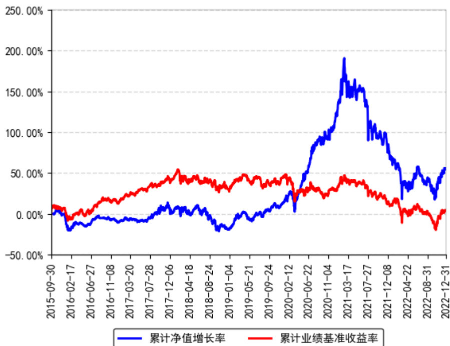
南方香港成长灵活配置混合累计净值增长率与同期业绩比较基准收益率的历史走势对比图