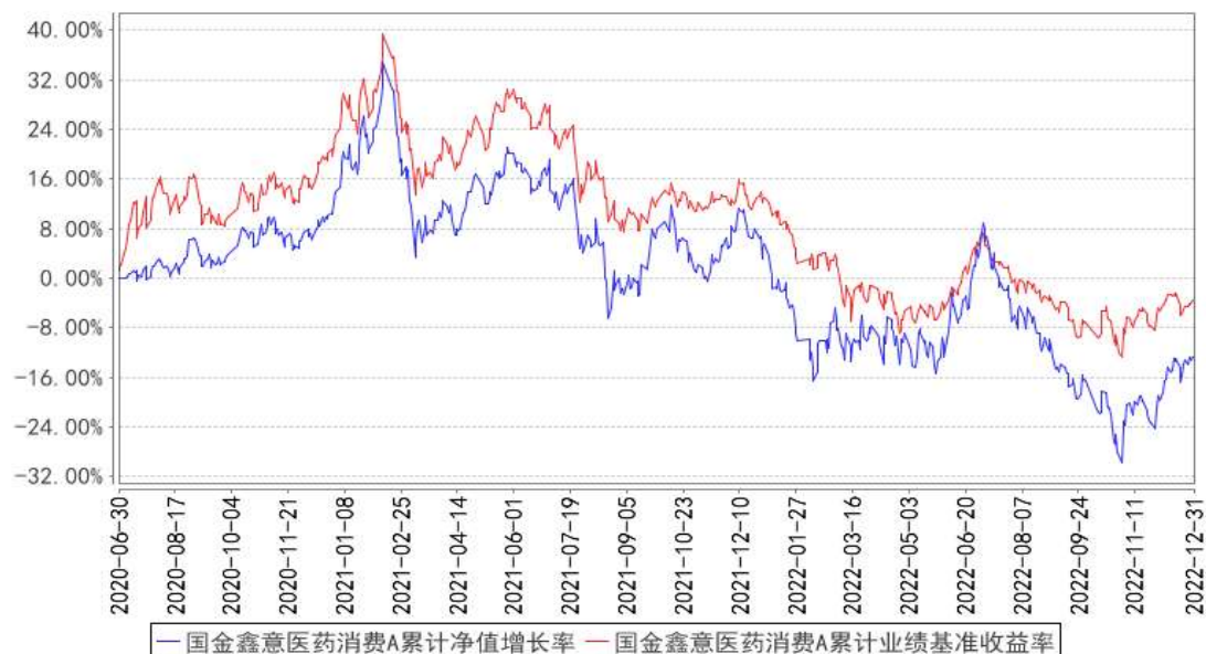
国金鑫意医药消费A累计净值增长率与同期业绩比较基准收益率的历史走势对比图